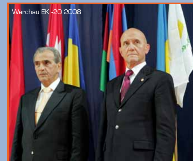
Warchau EK -20 2008